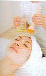
液状のパラフィンがパリッと固まり、肌を密閉して保湿。肌がじんわり温まり、毛穴も開く。

癒し 世界中で認められた カリスマのワザを堪能 「イヴロム シグネチャー フェイシャル」