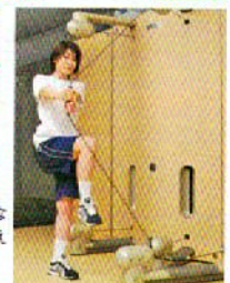
3次元の動きでゴルフに必要な筋肉を作るキネシス。体幹が鍛えられ、シェイプ効果も大。