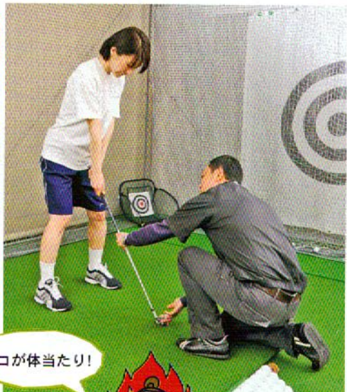
基礎から丁寧に教えてくれる個人レッスン(有料)。自由に練習できるフリーレンジもあり。

癒し 世界中で認められた カリスマのワザを堪能 「イヴロム シグネチャー フェイシャル」