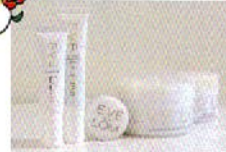
商品も取り扱う。スクラブ、デトックス、潤い補給の機能を兼ねたクレンザーがいちばん人気。

施術はすべてオールハンド。指圧を取り入れたマッサージで、顔の疲れがフワッとと化されるよう。